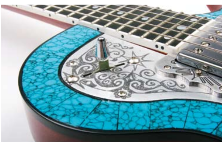
Een Strat-type schakelaar op een Les Paul-plek: Teye houdt zich aan geen enkele conventie

De Teye La India S heeft een unieke klank en daardoor eigenlijk geen rivalen. Wie eenzelfde soort uiterlijk zoekt kan terecht bij de Metal Front-serie van het huidige (Japanse) Zemaitis, zie www.zemaitis-guitars.com . De prijzen in Europa liggen rond de 3300 euro en je zult ervoor naar Duitsland moeten. Een andere topklasse gitaar met veelzijdige geluiden is bijvoorbeeld de PRS 25th Anniversary Custom 24.